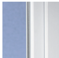
Un design classique aux contours adoucis

Avec les fenêtres PVC contemporaines en profilés VEKA, votre habitation est sûre de gagner en valeur. En effet, avec ses contours légèrement arrondis, le design classique intemporel de la gamme SOFTLINE crée une remarquable harmonie avec les styles d'architecture les plus variés – modernes ou traditionnels, construction neuve ou rénovation. La technique interne n'est pas en reste en termes