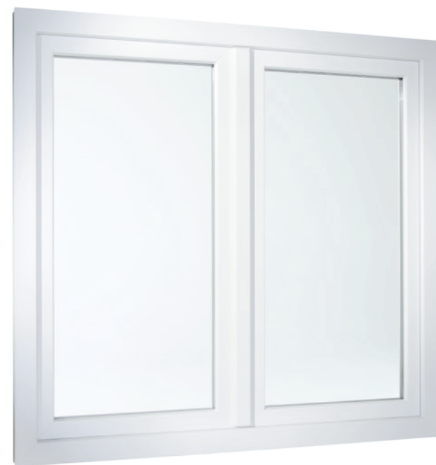
Fenêtre 2 vantaux déclinée en version semi-affleurante